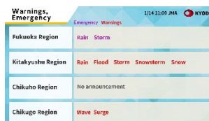
▲警報・特別警報情報 (提供元：株式会社共同通信デジタル)