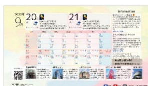
▲地域イベントカレンダー