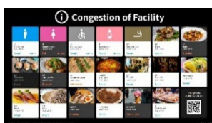
▲施設混雑情報