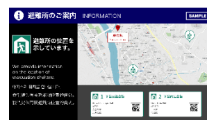
▲避難所情報