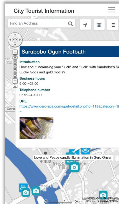
観光情報マップ(英語版)